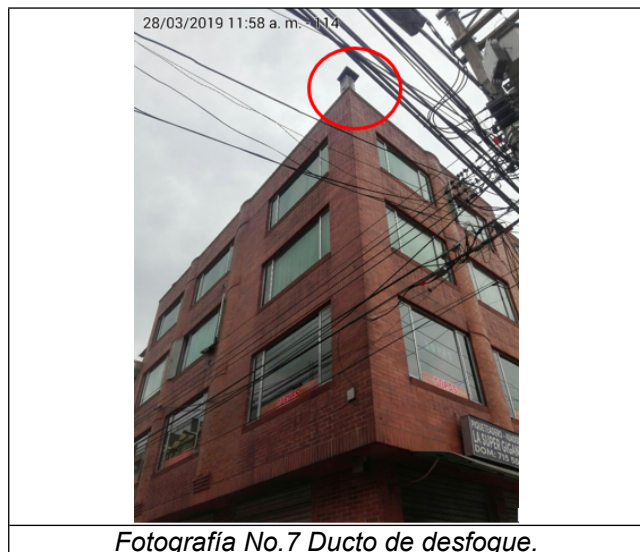
Fotografía No.7 Ducto de desfogue.