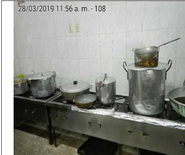
Fotografía No.3 Estufa de 6 puestos.