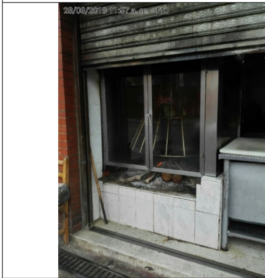
Fotografía No.5 Horno Asador sin confinar.