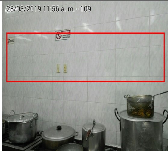
Fotografía No.4 Ausencia de campana extractora en la fuente.