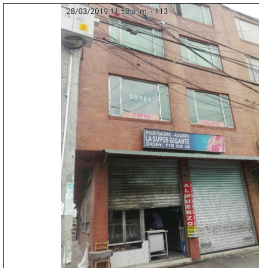
Fotografía No.1 Fachada del establecimiento comercial.