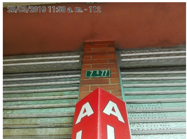
Fotografía No.2 Nomenclatura urbana del establecimiento.