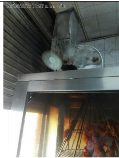
Fotografía No. 6 Tramo de ducto del horno asador.